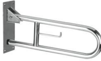
BG0800C acabado brillante