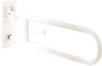
BG0800 acabado epoxi blanco