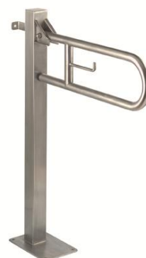
BGC710CS acabado satinado