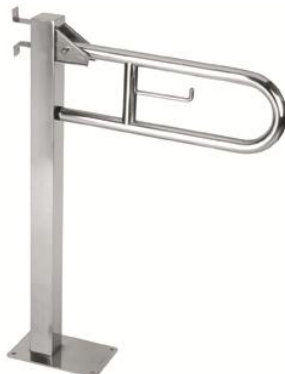
BGC710C acabado brillante