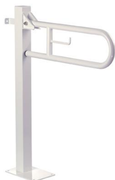
BGC710 acabado epoxi blanco