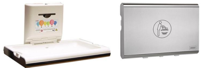
CP0016HCS Polipropileno/Acero inoxidable acabado satinado