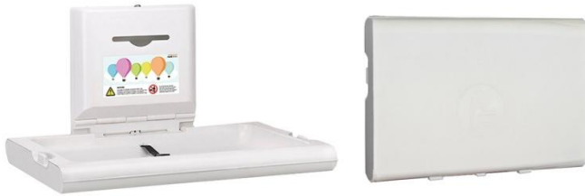
CP0016H Polipropileno acabado blanco