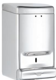
DJ0030C acabado brillante