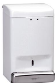
DJ0030 acabado blanco