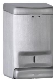
DJ0030CS acabado satinado