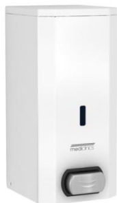
DJ0031 Acabado blanco