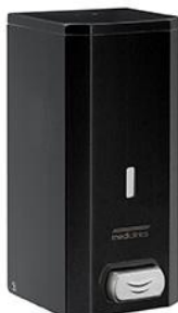
DJ0031B Acabado negro