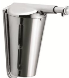
DJ0110C Acabado brillante