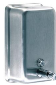
DJ0111CS Acabado satinado