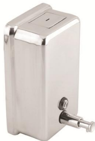
DJ0111C Acabado brillante