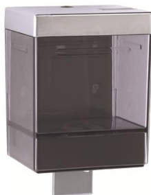
DJ0515F Acabado negro fumé