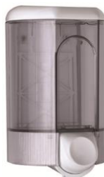
DJ0563F - DJ0561F Acabado blanco fumé