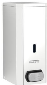
DJF0032C Acabado brillante