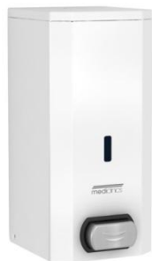
DJF0032 Acabado blanco