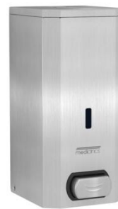
DJF0032CS Acabado satinado