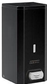
DJF0032B Acabado negro