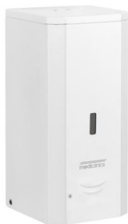
DJF0038A Acabado blanco