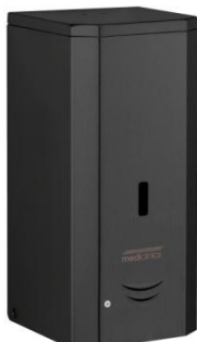
DJF0038AB Acabado negro