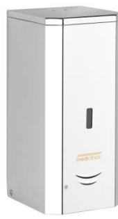
DJF0038AC Acabado brillante