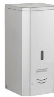
DJF0038ACS Acabado satinado