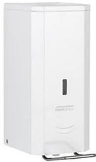
DJFP035 Acabado blanco