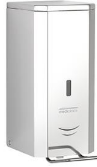
DJFP035C Acabado brillante