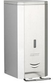
DJFP035CS Acabado satinado