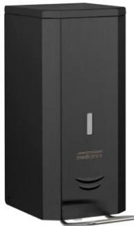
DJFP035B Acabado negro