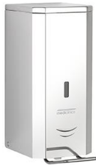
DJP0034C Acabado brillante