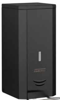
DJP0034B Acabado negro