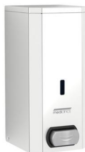
DJS0033C Acabado brillante