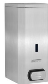
DJS0033CS Acabado satinado