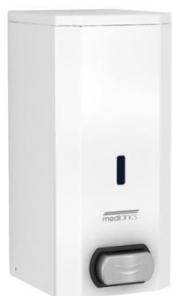
DJS0033 Acabado blanco