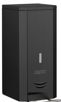
DJSP036B Acabado negro