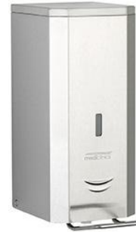
DJSP036CS Acabado satinado