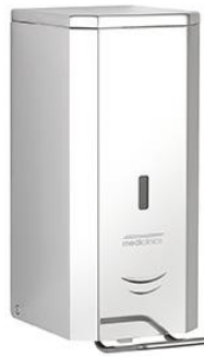
DJSP036C Acabado brillante