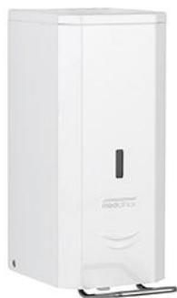
DJSP036 Acabado blanco