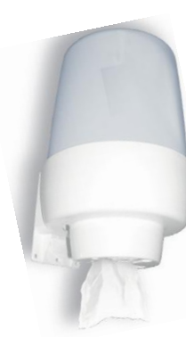
DT0602 PP blanco/gris