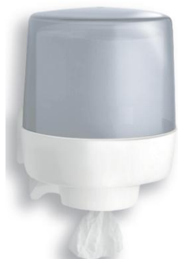
DT0601 PP blanco/gris