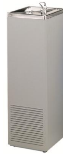
FA0015G Acabado plastificado gris