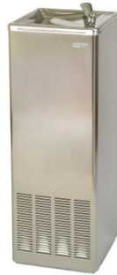
FA0015C Acabado brillante