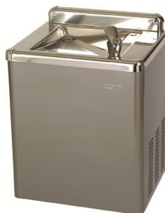
FA0025UP Acabado gris