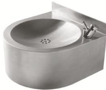
FAM110CS Acabado satinado