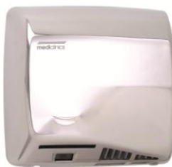
M17AC Acabado brillante