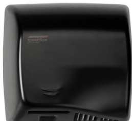
M17AB Acabado negro mate