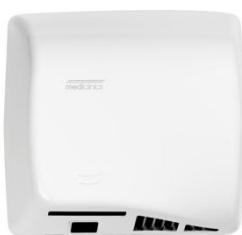
M17A Acabado blanco