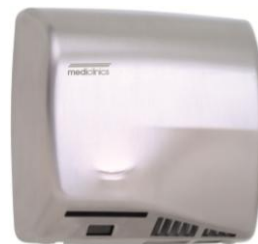
M17A Acabado satinado