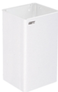
PP1065 / PP1080 acabado epoxi blanco