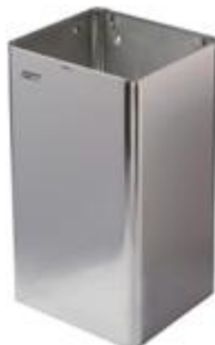
PP1065C / PP1080C acabado brillante