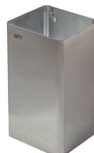
PP1065CS / PP1080CS acabado satinado