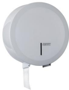
PR2783 Acabado blanco