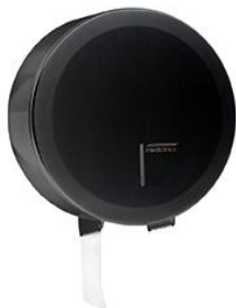
PR2783B Acabado negro