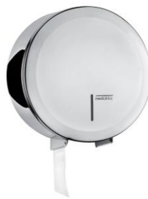
PR2787C Acabado brillante