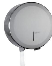
PR2787CS Acabado satinado