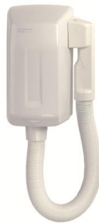
SC0004 Acabado blanco