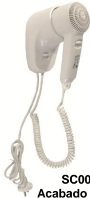
SC0010 Acabado blanco