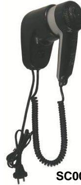
SC0010CS Acabado negro