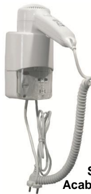
SC0030 Acabado blanco