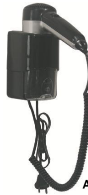
SC0030CS Acabado negro