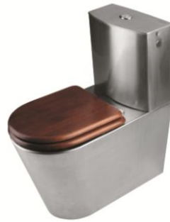
SN0110CS - acabado satinado SN0110C - acabado brillante