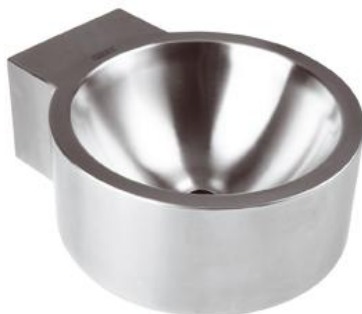
SNLM42CS Acabado satinado