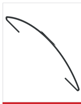
Opción: inserção decorativa em preto