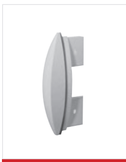
Tampa da extremidade padrão