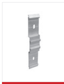
Placa de encaixe em centros de 600 mm