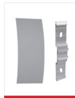
Placa de encaixe