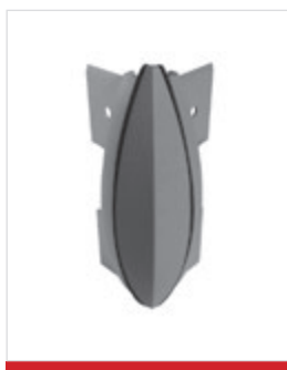
Canto externo 90°