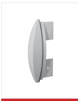
Tampa da extremidade padrão