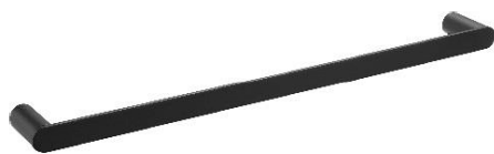
AI1313B Acabamento Preto