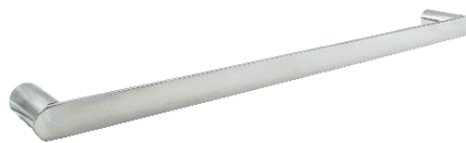
AI1313C Acabamento Brilhante