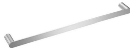
AI1313CS Acabamento Escovado