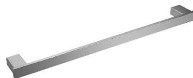
AI1413CS Acabamento Escovado