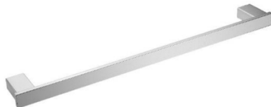
AI1413C Acabamento Brilhante