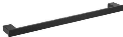
AI1413B Acabamento Preto