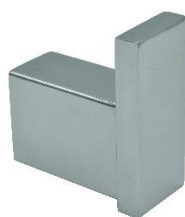
AI1418C Acabamento Brilhante