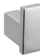
AI1418CS Acabamento Escovado