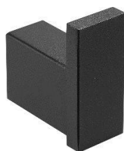
AI1418B Acabamento Preto