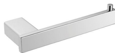
AI1421CS Acabamento Escovado