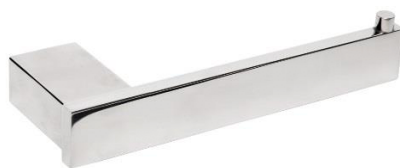
AI1421C Acabamento Brilhante