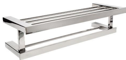
AI1423C Acabado brillante