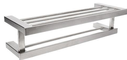
AI1423CS Acabado satinado