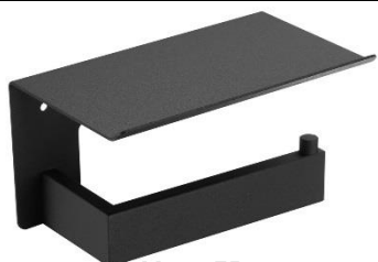
AI2005B Acabado negro