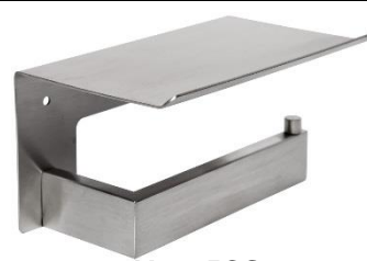
AI2005CS Acabado satinado