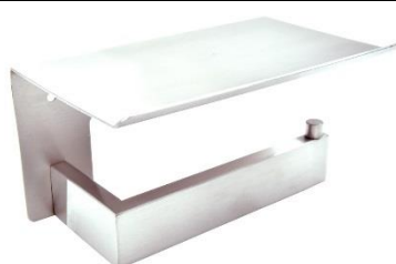
AI2005C Acabado brillante