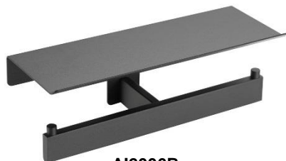
AI2006B Acabado negro