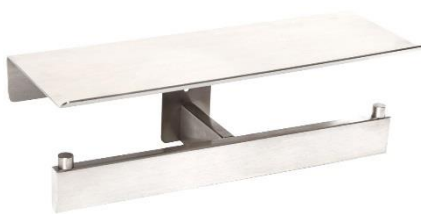
AI2006C Acabado brillante