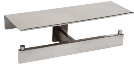
AI2006CS Acabado satinado