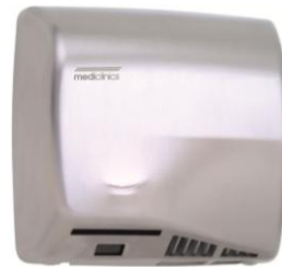
M17A Acabado satinado