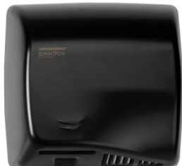
M17AB Acabado negro mate