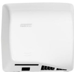
M17A Acabado blanco