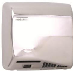
M17AC Acabado brillante