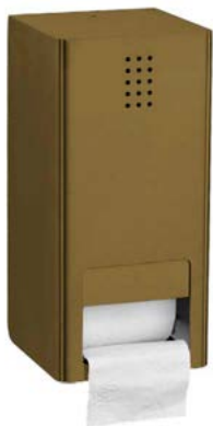
BR-300 / PVD BRONZE