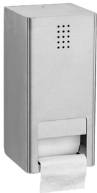
PU-300 / ESCOVADO