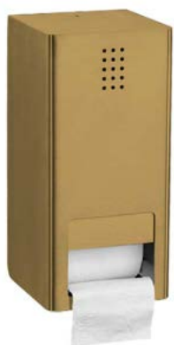
ME-300 / PVD LATÃO