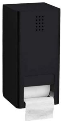
DP-300 / PRETO RAL 9005