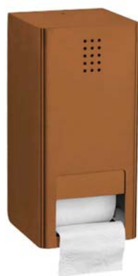
KU-300 / PVD COBRE