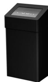
PP2020B / PP2050B acabado epoxi negro