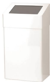
PP2020 / PP2050 acabado epoxi blanco