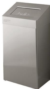
PP2020CS / PP2050CS acabado satinado