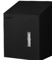
DT2201B Acabado Epoxy negro