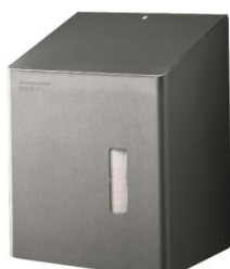
DT2201CS Acabado satinado