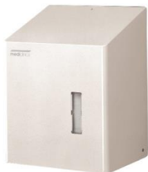
DT2201 Acabado Epoxy blanco