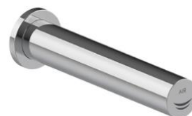
M095AX – Ficha Tec.

A MEDICLINICS reserva-se ao direito de efectuar alterações na presente ficha técnica e/ou no produto sem necessidade de comunicação prévia. © MEDICLINICS