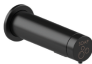
DJ003AX – Ficha Tec.