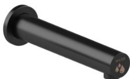
GA003AX – Ficha Tec.

Link das fichas técnicas dos componentes do UCM095AX